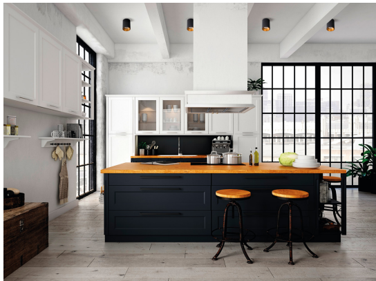
KANLUX S.A. (kat 27571) RITI GU10 B/G + TOMI LED5W / LDC (Polar)

Luminaire: KANLUX S.A. (kat 27571) RITI GU10 B/G + TOMI LED5W Lamps: 1 x TOMI LED5W GU10-WW