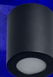
SANI IP44 DSO-B