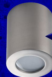
SANI IP44 DSO-SN