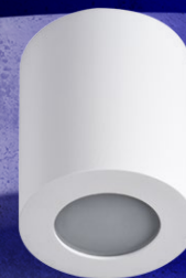
SANI IP44 DSO-W

La gamme se compose de luminaires en 3 couleurs: blanc, noir et nickel satiné.