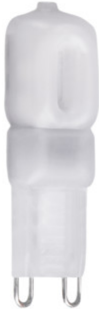
GIO LED G9