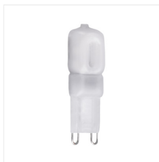
GIO LED G9