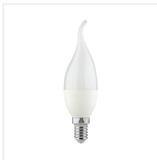
IDO 6,5W E14