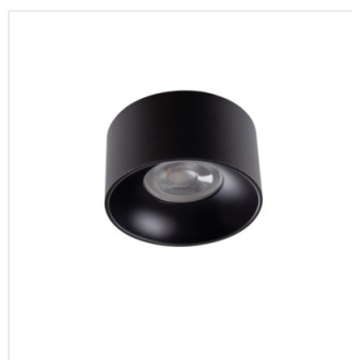
MINI RITI GU10 B/B