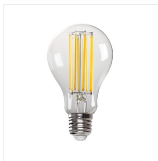
XLED A70 18W-NW