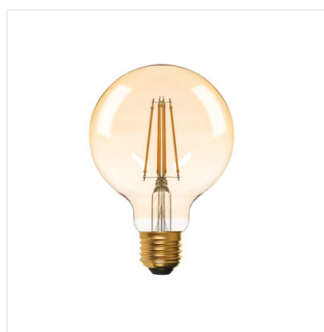
XLED G95 7W-WW