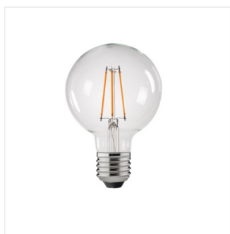
XLED G95C 7W-WW