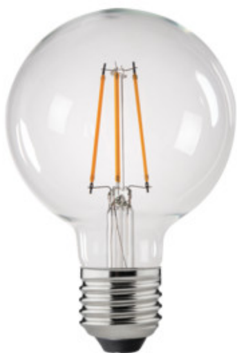
XLED G95C 7W-WW