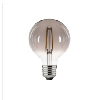
XLED G95S 5,8W-NW