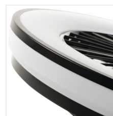
PLAVE LED CCT