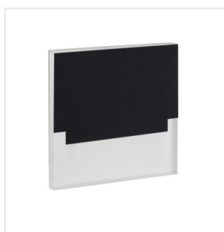
SABIK LED B-NW