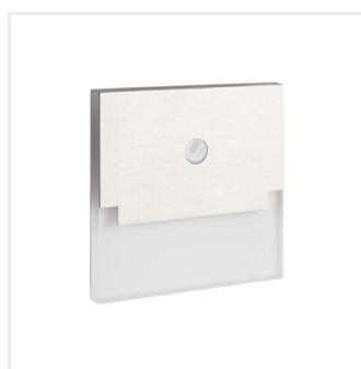
SABIK LED PIR WW