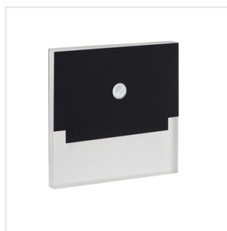
SABIK LED PIR B-NW