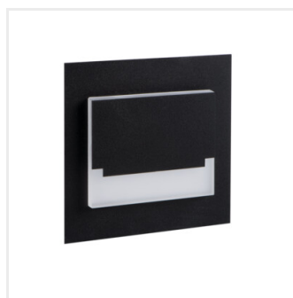
SABIK MINI LED B-NW