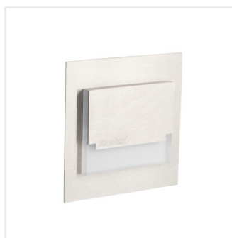
SABIK MINI LED NW