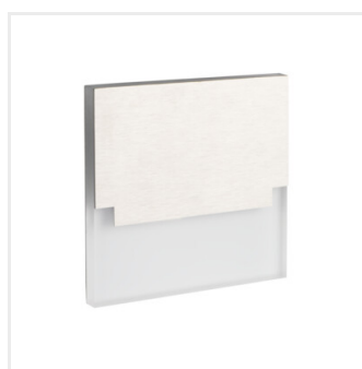
SABIK LED WW