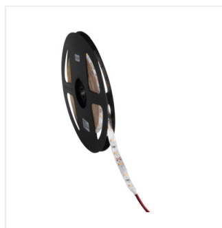
LEDS-B 4.8W/M IP65