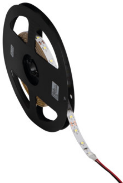
LEDS-B 4.8W/M IP00