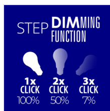
XLED A60 7W-STEPPDIM