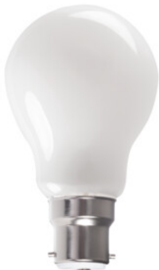
XLED A60 B22 7W-WW-M