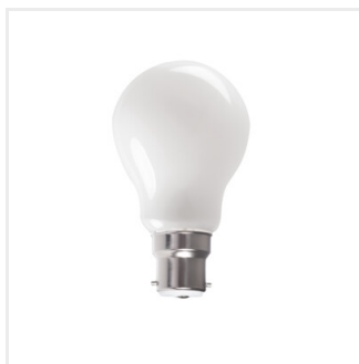
XLED A60M B22 7W, 10W