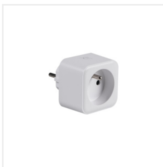
S AD GN 16A PM