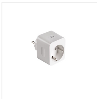
S AD GN SCH 10A PM

Díky zásuvkovému adaptéru můžeme ovládat (funkce ZAP/VYP) zařízení bez funkce SMART (např. žehlička). Můžeme také nastavit sled činností, které jsme vybrali. Hlavní funkcí je ZAP/VYP, ale adaptér má také vestavěné hodiny (týdenní s kalendářem), náhodnou funkci a funkci počítadla/odpočítávání. Díky tomu můžeme naprogramovat zapínání a vypínání různých zařízení v určitých časech i když nejsme doma. Adaptér má navíc funkci měření spotřeby energie (zařízení, které je k němu připojeno). Další informace o Kanlux SMART naleznete na stránkách www.kanluxsmart.cz .