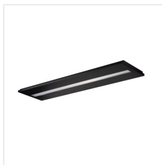
OS MPRM B P3