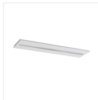
OS MPRM W P3