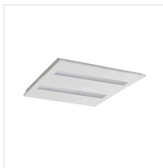
OS MPRM W P1