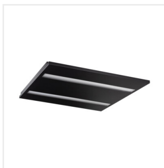
OS MPRM B P1