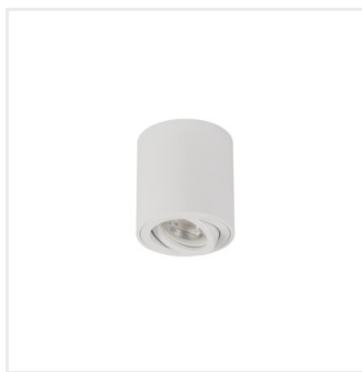
BORD ONE DLP-50-W