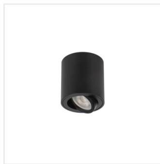
BORD ONE DLP-50-B