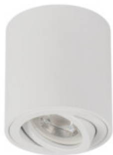
BORD ONE DLP-50-W