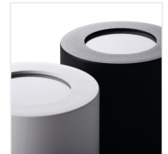
SANI IP44 DSO-B