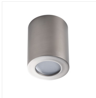
SANI IP44 DSO-SN