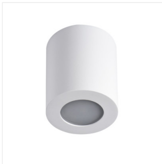
SANI IP44 DSO-W