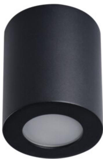
SANI IP44 DSO-B