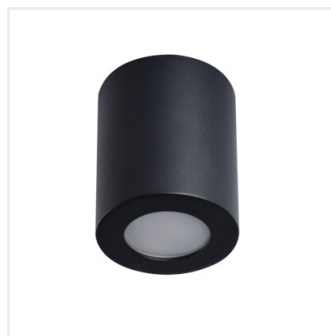
SANI IP44 DSO-B