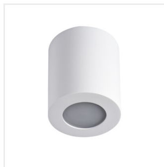
SANI IP44 DSO-W