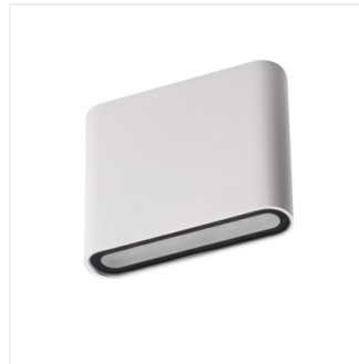
GARTO LED EL 8W-W