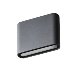
GARTO LED EL 8W-GR