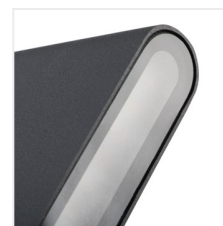
GARTO LED EL 8W-GR