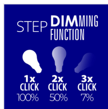
XLED A60 7W-STEPPDIM