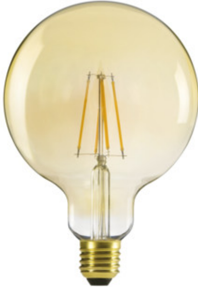
XLED G125 7W