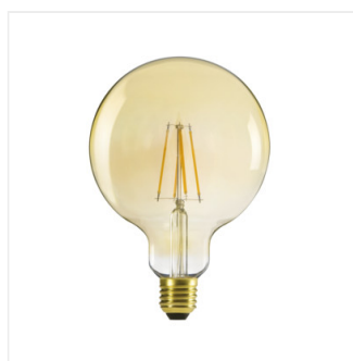
XLED G125 7W