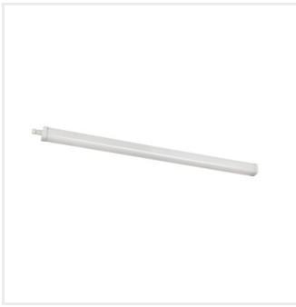
TP STRONG ECO 46W-NW