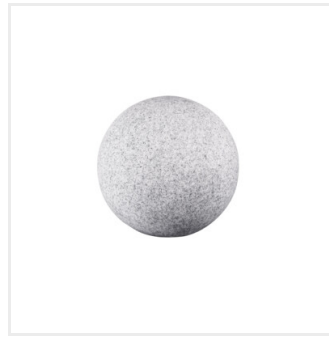
STONO 230 N