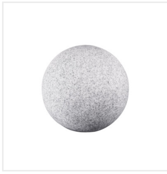
STONO 315 N