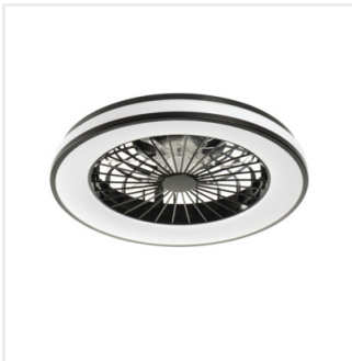
PLAVE LED CCT