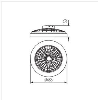
PLAVE LED CCT