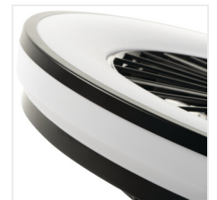
PLAVE LED CCT