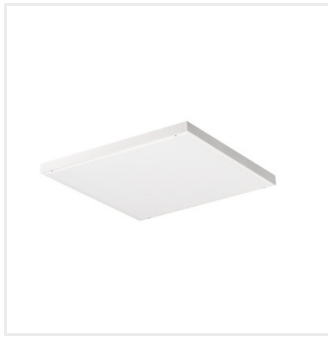
BLINGO U 34W SR 60 NW