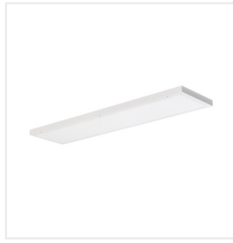
BLINGO U 34W SR 120NW