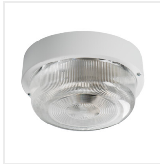
TUNA MINI N