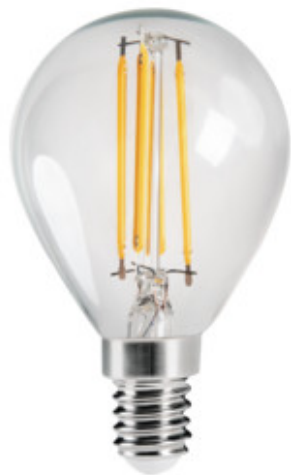
XLED G45 E14 4,5W