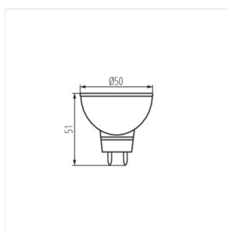
TOMI LED 5W MR16