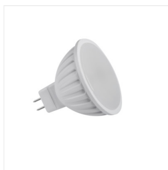
TOMI LED 5W MR16