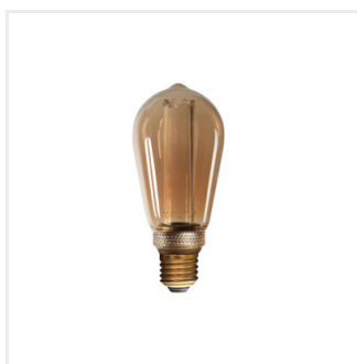
ST64 A 4W-SW