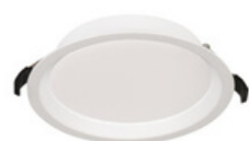
TIBERI CCT 15-21W-B