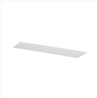
BRAVO S 40W12030NW W