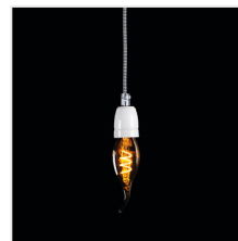
XLED C35T 2,5W-SW