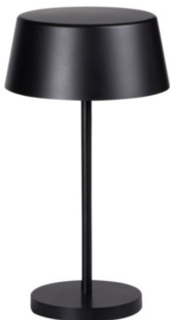
DAIBO LED T-B