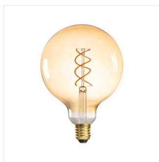
XLED G125 5W-SW