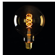
XLED G125 5W-SW