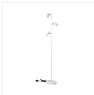
EVALO FL 3xGU10 W-SR