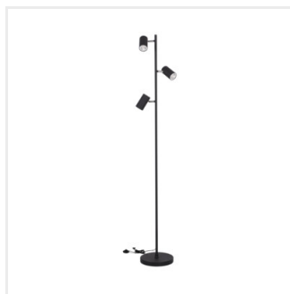
EVALO FL 3xGU10 B-SR