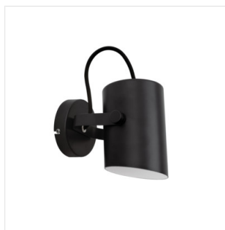
LARATA EL-10 B