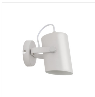
LARATA EL-10 W