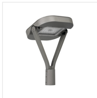
PARCOLI 30-50W CCT G