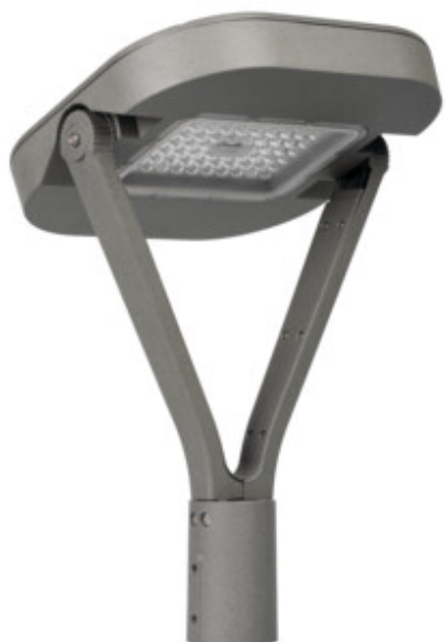
PARCOLI 30-50W CCT G