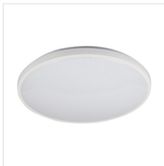
ARVOS N LED 37W CCT W