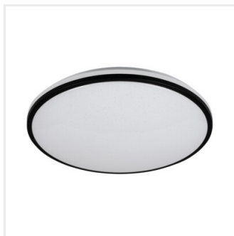
ARVOS N LED 37W CCT B