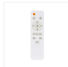
ARVOS N LED 37W CCT B