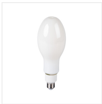
XLED HP D90E27 26W-NW