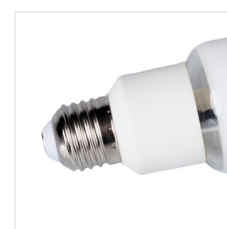
XLED HP D90E27 26W-NW