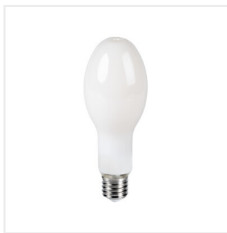
XLED HP D90E40 36W-NW