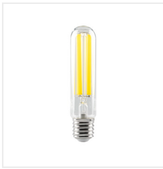
XLED HP D46E40 38W- NW