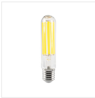
XLED HP EX E40 43W-NW