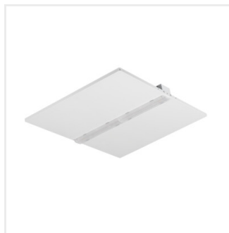
KND W P1