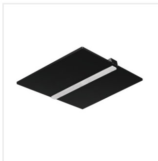
KND B P1