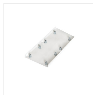
AMPLINE 4LED FIX-W