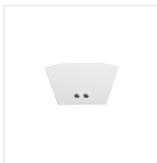
AMPLINE 4LED ENDCAP-W