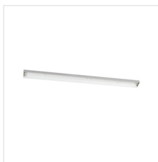
AMPLINE 4LED 2-150-W