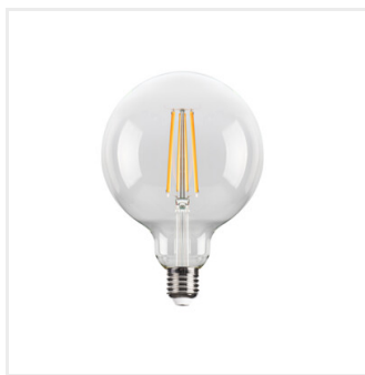
XLED G125C 10,5W-NW