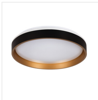
SOLN LED CCTDIM B/G