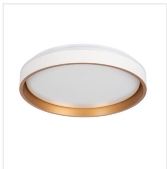
SOLN LED CCTDIM W/G