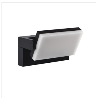
XERTO EL 20W B