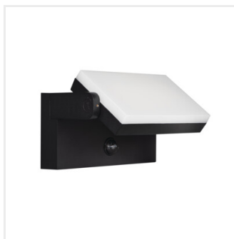
XERTO EL 20W SE B