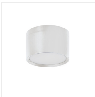
TIBERI PRO NT20W-940W