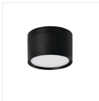
TIBERI PRO NT20W-940B