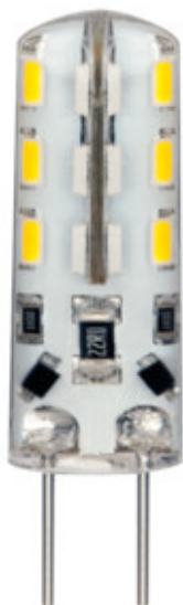
TANO G4 SMD