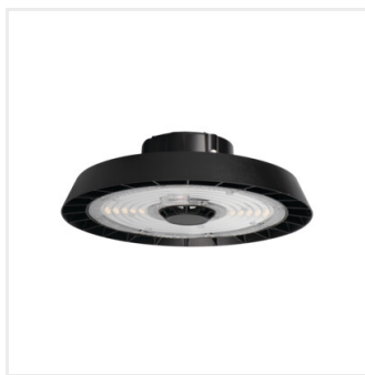
HB PROSTRONG 150WD