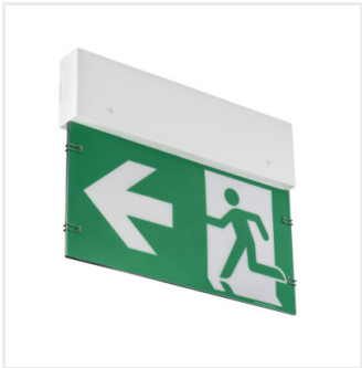
ONTEC G E1E180NMATW