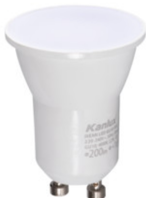
REMI LED GU10-NW