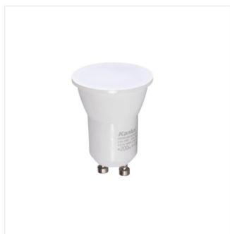
REMI LED GU10-NW